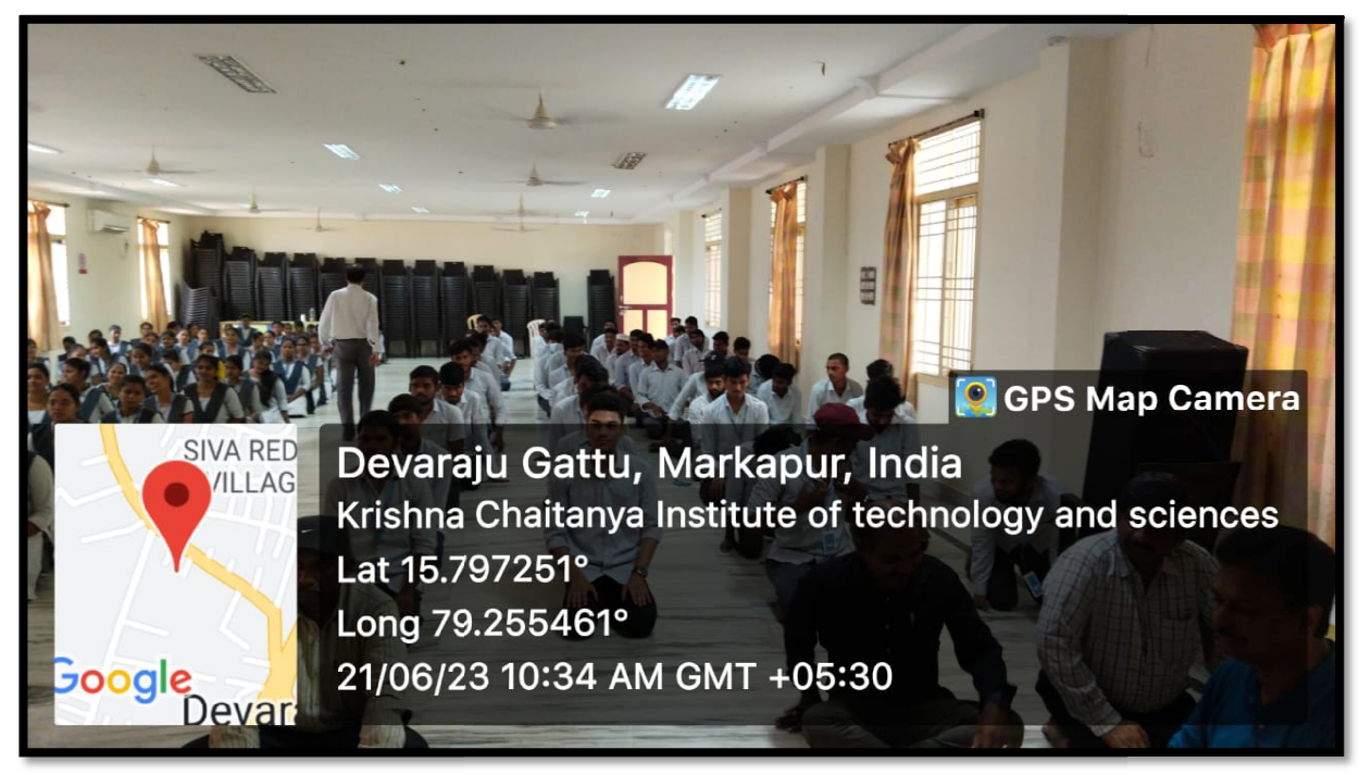
FOLLOWING THE ASANAS TOUGHT BY THE YOGA TRAINER